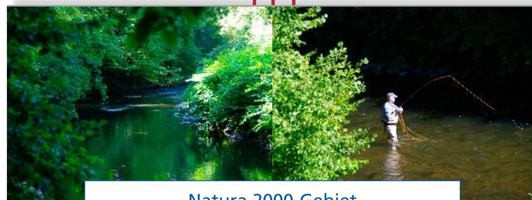
Natura 2000-Gebiet (besonderer Schutz von Fauna und Flora)